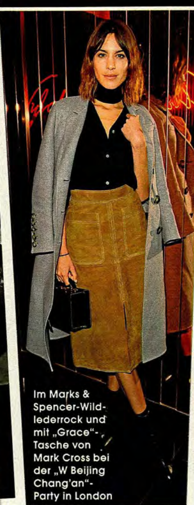
Im Marks & Spencer-Wildlederrock und mit „Grace“-Tasche von Mark Cross bei der „W Beijing Chang'an“-Party in London