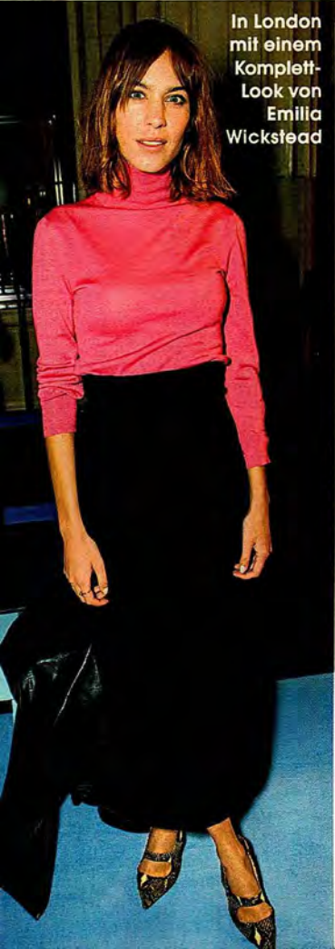
In London mit einem Komplett-Look von Emilia Wickstead