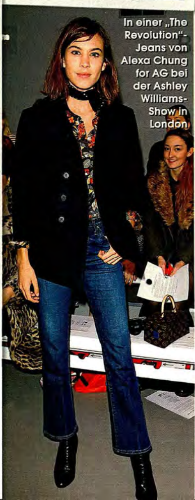
In einer „The Revolution“-Jeans von Alexa Chung for AG bei der Ashley Williams-Show in London