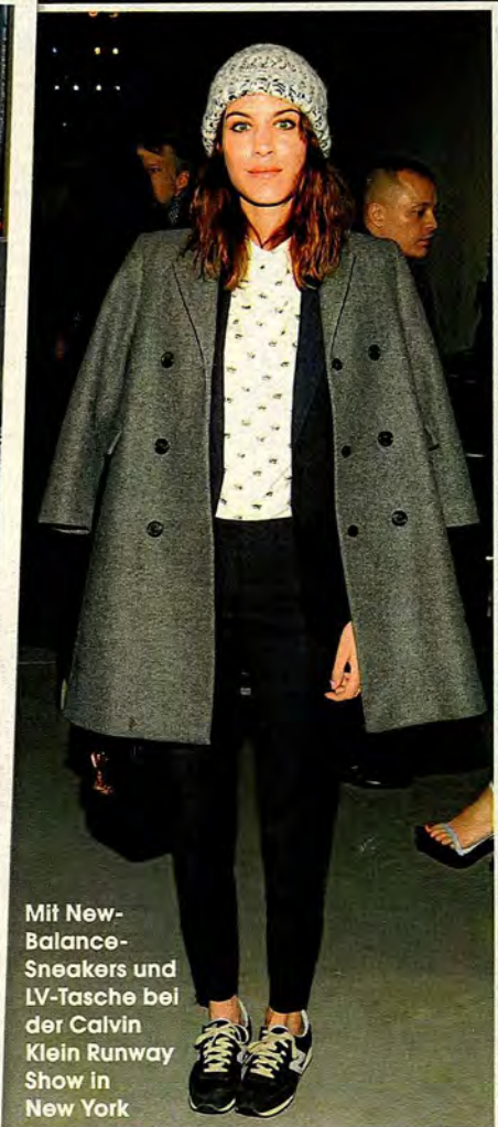
Mit New-Balance-Sneakers und LV-Tasche bei der Calvin Klein Runway Show in New York