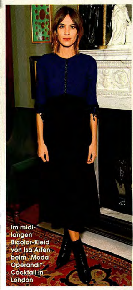
Im midilangen Bicolor-Kleid von Isa Arfen beim „Moda Operandi“-Cocktail in London