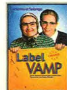
Le spectacle à ne pas rater: Label Vamp