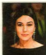
Son gourou: Monica Bellucci