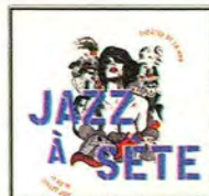
Le festival où la trouver: Jazz à Sète, du 13 au 19 juillet 2015