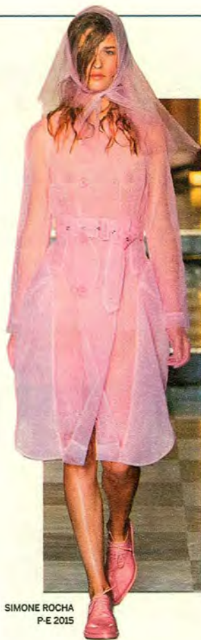
SIMONE ROCHA P-E 2015