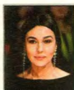
Son gourou: Monica Bellucci