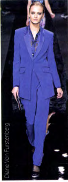
Diane Von Furstenberg