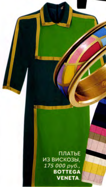
ПЛАТЬЕ ИЗ ВИСКОЗЫ, 175 000 руб., BOTTEGA VENETA.

Одежда как конструктор лего: поклонники хиппи выбирают печворк, минималисты – квадрат.