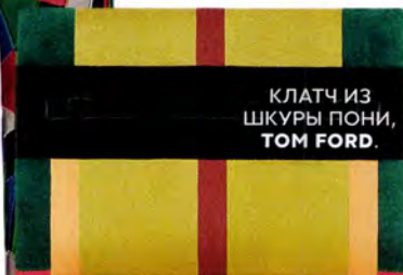
КЛАТЧ ИЗ ШКУРЫ ПОНИ, TOM FORD.