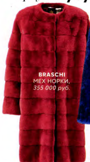
BRASCHI МЕХ НОРКИ, 355 000 руб.

Яркую шубу героини Педро Альмодовара надевали с мити, а вы – с джинсами.