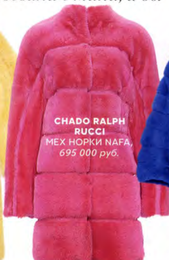
CHADO RALPH RUCCI МЕХ НОРКИ NAFA, 695 000 руб.