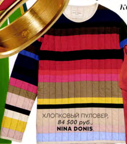
ХЛОПКОВЫЙ ПУЛОВЕР, 84 500 руб., NINA DONIS.