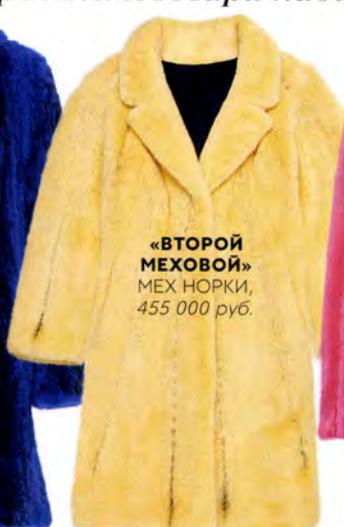
«ВТОРОЙ МЕХОВОЙ» МЕХ НОРКИ, 455 000 руб.