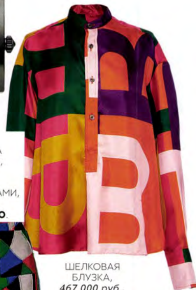
ШЕЛКОВАЯ БЛУЗКА, 467 000 руб., BALLY.