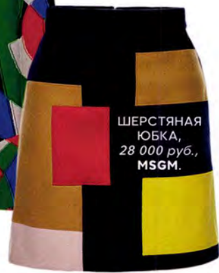
ШЕРСТЯНАЯ ЮБКА, 28 000 руб., MSGM.

Яркую шубу героини Педро Альмодовара надевали с мити, а вы – с джинсами.