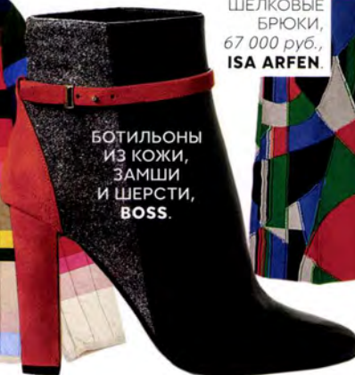
БОТИЛЬОНЫ ИЗ КОЖИ, ЗАМШИ И ШЕРСТИ, BOSS.