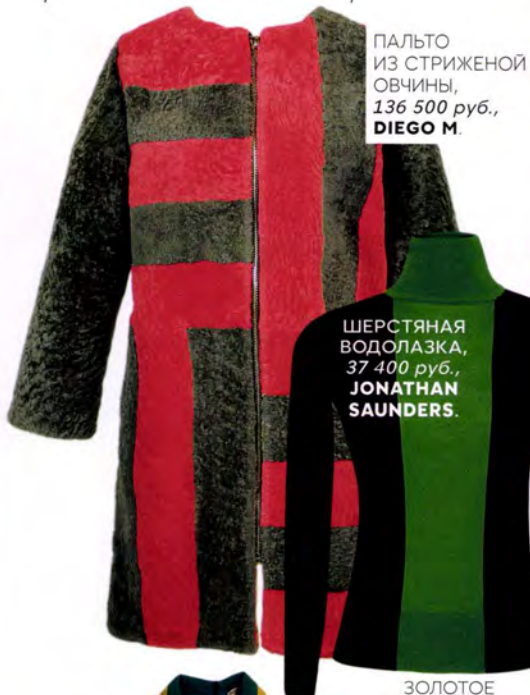
ПАЛЬТО ИЗ СТРИЖЕНОЙ ОВЧИНЫ, 136 500 руб., DIEGO M.