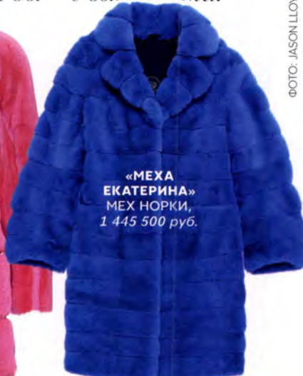
«МЕХА ЕКАТЕРИНА» МЕХ НОРКИ, 1 445 500 руб.