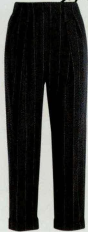
细条纹羊毛九分裤 Lanvin