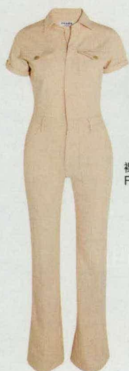
裸色弹力牛仔连身裤 FRAME DENIM