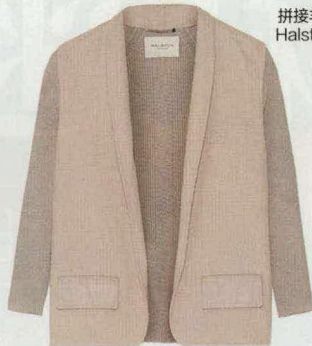
拼接羊毛休闲外套 Halston Heritage