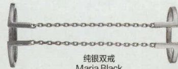
纯银双戒 Maria Black