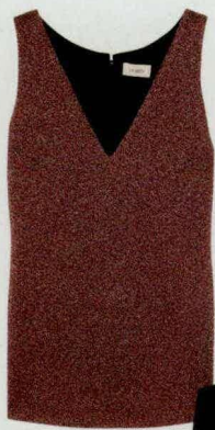
金属感针织背心 Isa Arfen