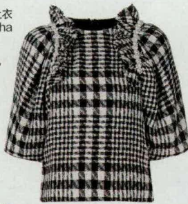
带缀饰千鸟纹上衣 Simone Rocha