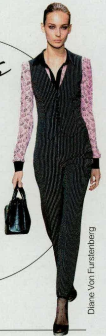
Diane Von Furstenberg

作为职场搭配最多见的元素之一,挑选颜色和粗细不一的条纹可以丰富视觉,不妨搭配简单的毛衣打造轻松时髦的职场造型。