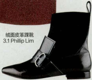
绒面皮革踝靴 3.1 Phillip Lim